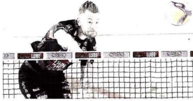
Lo "Zar de Citanò", Ivan Zaytsev, chiama a raccolta i tifosi biancorossi

ARTICOLO NON CEDIBILE AD ALTRI AD USO ESCLUSIVO DEL CLIENTE CHE LO RICEVE - 4