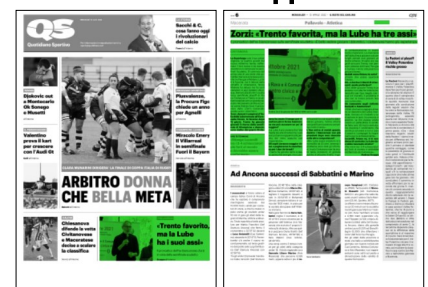
Superficie 44 %